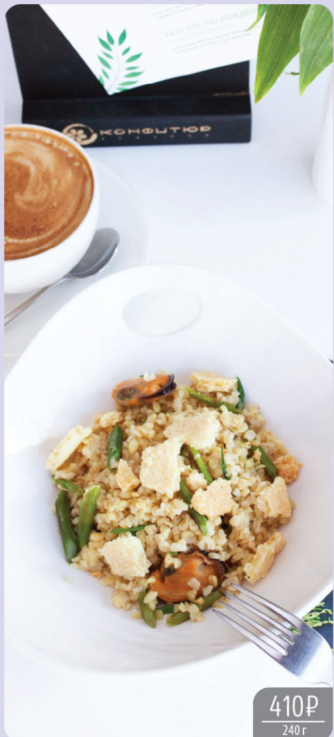
Булгур с мидиями, спаржей и пармезановым печеньем

Bulgur with mussels, asparagus and Parmesan cookies