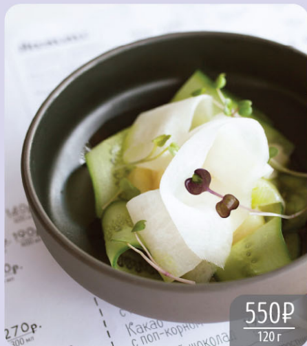
Севиче из гребешка с соусом маракуйя

Scallop ceviche with passion fruit sauce