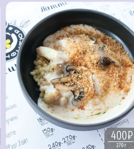
Рапан с птитимом и луковым муссом