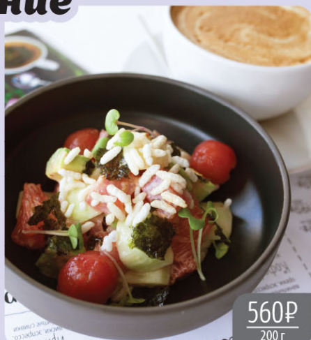
Салат с тунцом, авокадо, грейпфрутом и маринованными томатами черри

Tuna salad, avocado, grapefruit and pickled cherry tomatoes