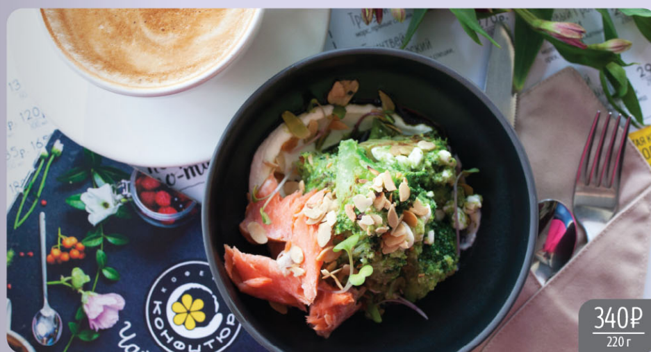
Брокколи с копчёным лососем и кремом пармезан

Broccoli with smoked salmon and Parmesan cream